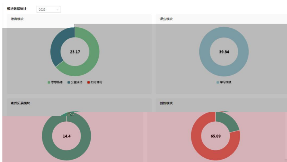
综合评价四力模型